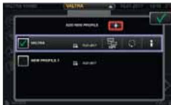
Profile für Fahrer und Arbeitsgeräte, die einfach über jedes beliebige Bildschirmenü geändert werden können. Alle Einstellungsänderungen werden im ausgewählten Profil gespeichert.