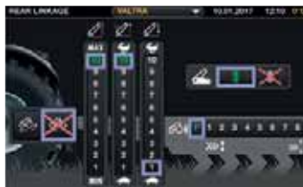
Intuitives Festlegen von Einstellungen mit großen Bedienelementen und leicht verständlichen Funktionen.