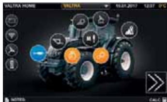
Übersichtliche und realitätsorientierte Benutzeroberflächen und Menüstruktur.

Valtra SmartTouch hat die Benutzerfreundlichkeit auf eine neue Ebene gebracht. Es ist intuitiver als Ihr Smartphone. Die Einstellungen können mit nur zwei Tipp- oder Wischbewegungen erreicht und verändert werden. Alle Technologieoptionen sind in das neue, einfach zu nutzende SmartTouch Terminal integriert: AutoGuide, ISOBUS, automatische Teilbreitenschaltung, variable Ausbringmengensteuerung und TaskDoc.