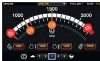
Logisch aufgebaute Einstellmenüs. Veränderung der Einstellungen durch einfaches Verschieben der Einstellcurser. Alle Veränderungen werden automatisch gespeichert.