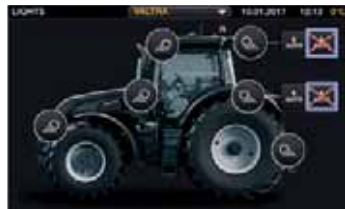
Einfache Konfiguration der Arbeitsscheinwerfer über das Terminal. Ein-/Ausschalter für die Arbeitsscheinwerfer in der Armlenke mit Ein-/Ausschalter für Rundumleuchte.