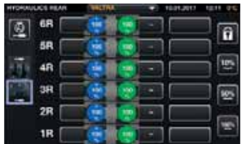
Die Hydraulik kann über jedes Bedienelement gesteuert werden, auch die Hydraulikventile (vorne und hinten), Hubwerke (Front und Heck) oder der Frontlader.